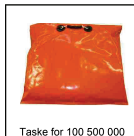
Taske for 100 500 000

Tragten er fremstillet af en mineral- og brændselsoliebestandig dug med et temperaturområde fra - 23°C til max. + 70°C. Kan også anvendes til nogle enkelte former for kemikalier f.eks., saltsyre 15%, ammoniakopløsning 15% og kaustisk soda 15%.